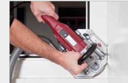
... mit TangaDelta S2