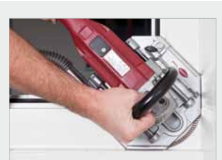
Schnitt in die Fensterleibung