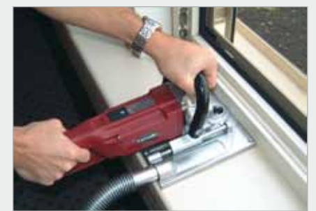
Schnitt in den Holzrahmen