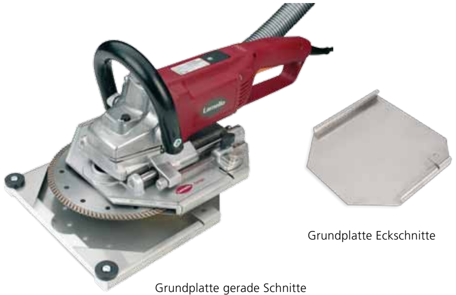
Grundplatte gerade Schnitte

Demontage durch Schnitt in die Fensterleibung Ausgerüstet mit einem Diamantblatt und zwei Grundplatten für Eck- sowie gerade Schnitte