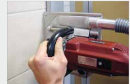
Schnitt in Fliesenwand