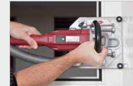
... mit TangaDelta S2