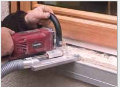
Ausschnitt für Wetterschenkel