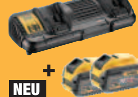
NEU DCB 132 X2** System-Doppelladegerät DCB132 + 2 x Akku DCB547 (je mit 162 Wh) 419,-* (498,61 inkl. MwSt.)