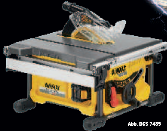
Abb. DCS 7485

vergleichbar stark wie 1.300 WATT im Netzbetrieb! * verglichen mit DW5520