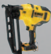
DCN 660 NT Nagler - 48 Joule Einschlagenergie - 1,4 x 1,6 mm Stauchkopfnägel 389,-* (462,91 inkl. MwSt.)