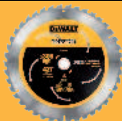
Abb. DT 99574