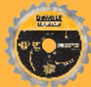
Abb. DT 99565