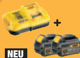
NEU DCB 118 T2** System-Schnellladegerät DCB118 + 2 x Akku DCB546 (je mit 108 Wh) 329,-* (391,51 inkl. MwSt.)