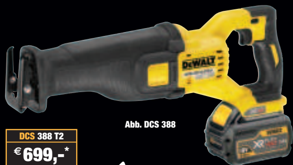
Abb. DCS 388

Erhältlich bei Ihrem Flexvolt-Partner. Bezugsquellen unter: http://www.dewalt-revolution.de