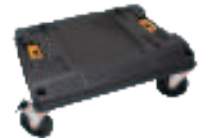
BEIM KAUF VON 3 NT-MASCHINEN* ERHALTEN SIE 1X +TSTAK CART