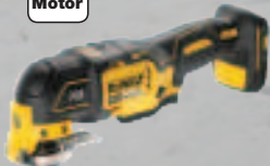
DCS 355 NT Multi-Tool - Oszillationen: 0- 20.000 min -1 199,-* (236,81 inkl. MwSt.)