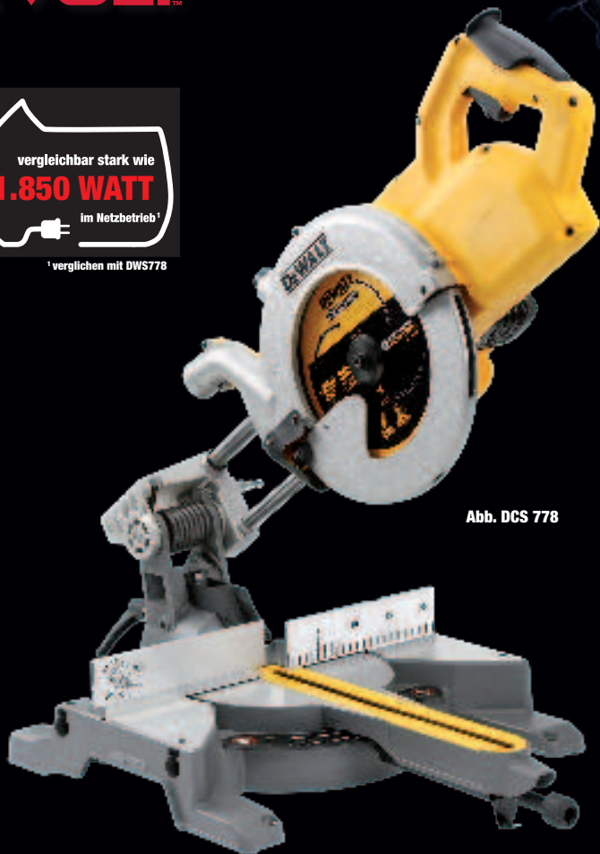
Abb. DCS 778

vergleichbar stark wie 1.850 WATT im Netzbetrieb 1 1 verglichen mit DWS778