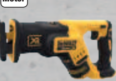
DCS 367 NT** NEU Säbelsäge - Leerlaufhubzahl: 0 - 2.900 min -1 209,-* (248,71 inkl. MwSt.)