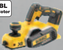
DCP 580 NT 82 mm Hobel - 2 mm max. Spanabnahme 179,-* (213,01 inkl. MwSt.)