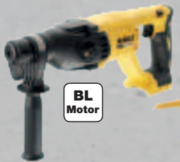
DCH 133 NT** NEU SDS-plus Kombihammer - 2,6 J Einzelschlagenergie - Max. Bohrdurchmesser (Beton): 26 mm 199,-* (236,81 inkl. MwSt.)