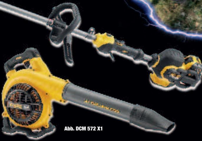
Abb. DCM 572 X1

DCM 571 X1 € 499,-* € 593,81 inkl. MwSt.