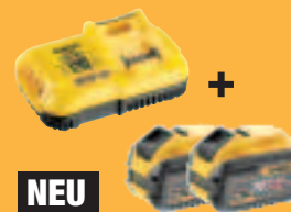
NEU DCB 118 X2** System-Schnellladegerät DCB118 + 2 x Akku DCB547 (je mit 162 Wh) 399,-* (474,81 inkl. MwSt.)