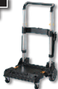
BEIM KAUF VON 5 NT-MASCHINEN* ERHALTEN SIE 1X +TSTAK TROLLEY

(Bestell-Nr.: TS TROLLEY / UVP: € 149,90*)