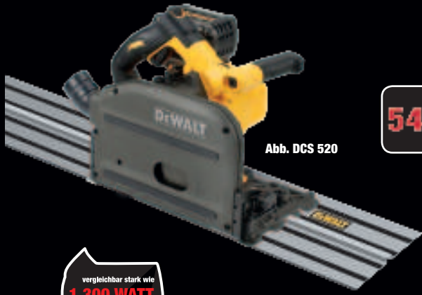
Abb. DCS 520

DCS 7485 N € 719,-* € 855,61 inkl. MwSt.