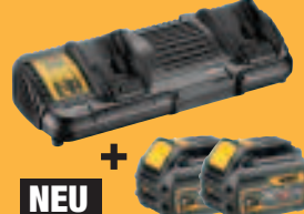
NEU DCB 132 T2** System-Doppelladegerät DCB132 + 2 x Akku DCB546 (je mit 108 Wh) 349,-* (415,31 inkl. MwSt.)