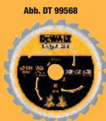
Abb. DT 99568