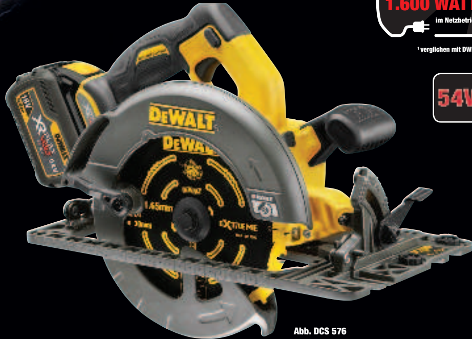
Abb. DCS 576

vergleichbar stark wie 1.600 WATT im Netzbetrieb 1