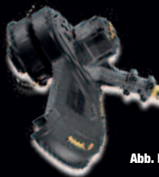
Abb. DCM 571 X1